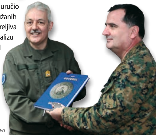
Zapovjednik EUFOR-a uručio dokumente o analizi stanja streljiva

Zapovjednik EUFOR-a generalvojnik Bernhard Bair zvanično je uručio Izvješće o projektu "Soteria" načelniku Zajedničkog stožera Oružanih snaga BiH general-pukovniku Miladinu Miložićiću u skladištu streljiva Kula u Mrkonjić Gradu. EUFOR-ov projekat "Soteria" predstavlja analizu stanja na šest perspektivnih lokacija za skladištenje streljiva u BiH koje OSBiH koriste za ovu namjenu. Procjenu stanja izvršio je tim EUFOR-a u suradnji sa OSBiH, NATO-om i OESS-om. Za uspjeh ovog projekta potrebno je da OSBiH imaju financijska sredstva dovoljna za podizanje standarda ovih objekata. Investicija ove vrste bi mogla dugoročno poboljšati opće stanje sigurnosti za građane BiH.