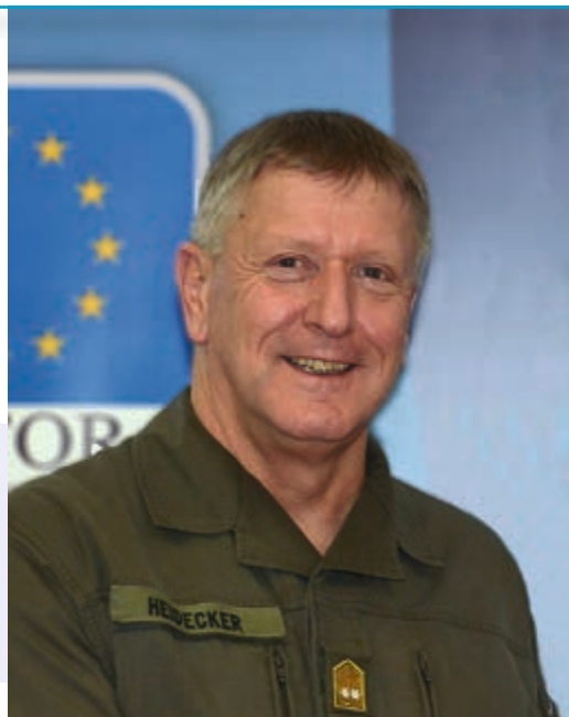
generalbojnik Dieter Heidecker

U prosincu 2014. je deseti rođendan EUFOR-a. Naša misija počela je 2. prosinca 2004. g., kada je EUFOR, misija pod vodstvom EU, zamijenila SFOR, misiju pod vodstvom NATO-a. Od tada se promijenilo i težište naših napora, a najvažnija promjena desila se 2012. godine, kada smo počeli implementirati program za osposobljavanje i obuku za Oružane snage BiH. Više o povijesti i razvoju naše misije možete pročitati u drugim člancima u časopisu.