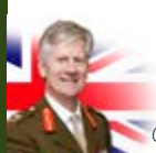
General-bojnik David Leakey