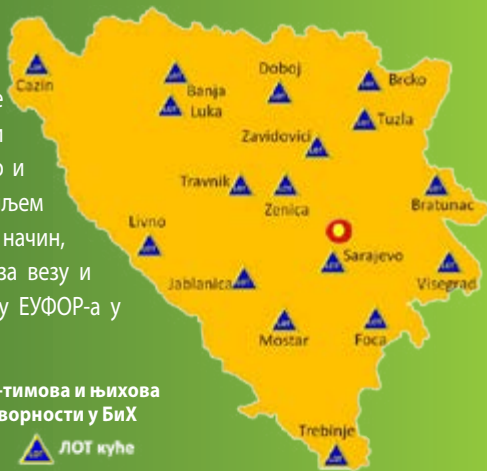
Мапа ЛОТ-тимова и њихова зона одговорности у БиХ

У Босни и Херцеговини има 17 Тимова за везу и посматрање (ЛОТ-кућа) који представљају "очи и уши" ЕУФОР-а. Они су у контакту с локалним властима и становништвом, као и бројним другим државним институцијама и агенцијама, с циљем подизања свијести о проблемима локалне заједнице. На тај начин, посредством Центра за координацију ЛОТ-кућа, Тимови за везу и посматрање обезбјеђују преглед ситуације Главном штабу ЕУФОР-а у Сарајеву.