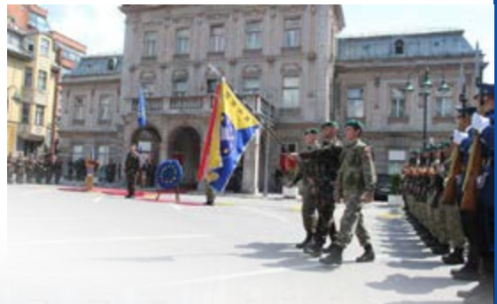
Војна парада – ЕУФОР-ов Мултинационални батаљон