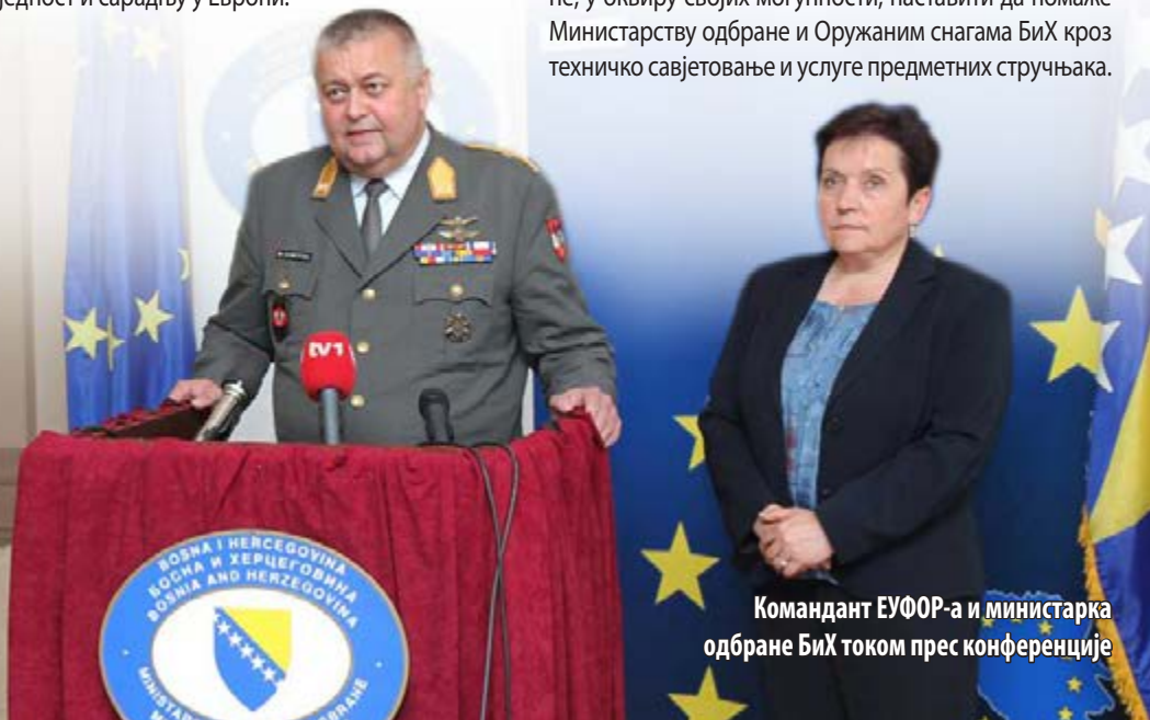
Командант ЕУФОР-а и министарка одбране БиХ током прес конференције

Командант ЕУФОР-а је на крају рекао: "Наставићемо да пружамо подршку МО и ОС БиХ у раду на успостављању процедура за складиштење и побољшавању инфраструктуре, да бисмо кроз заједничке напоре побољшали безбједно и стабилно окружење у БиХ, јер нам је то свима у интересу." ЕУФОР ће, у оквиру својих могућности, наставити да помаже Министарству одбране и Оружаним снагама БиХ кроз техничко савјетовање и услуге предметних стручњака.