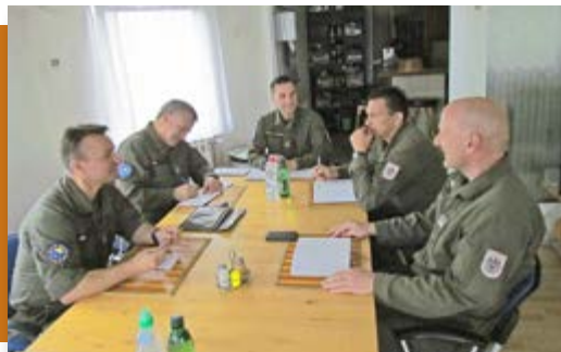
Припадници аустријске ЛОТ куће у Тузли током састанка

Аустрија је ушла у ЕУ 1994. године. Мировним снагама у БиХ придружила се почетком 1996. године и од тада игра важну улогу у одржавању мира и безбједности у овој земљи. Већ осам година, команда над војним снагама ЕУ (ЕУФОР-ом) дата је Аустрији. Садашњи Високи представник у БиХ, Њ.Е. др. Валентин Инцко је аустријски дипломата.