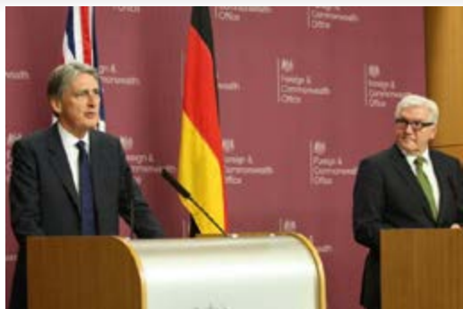
Британски и њемачки министар вањских послова Хемонд и Штајнмајер

стога смо и позвали политичаре да се обавезу на суштинске реформе и на тај начин смо понудили БиХ могућност да оствари напредак ка чланству у ЕУ. БиХ је поднијела захтјев за чланство у ЕУ. То је добра вијест. Али пуно тога још мора да се уради! Не само у погледу социјално-економских реформи, него и у погледу владавине права. Прије више од годину дана, бх. политичари су се обавезали на реформе које су уско везане за Споразум за раст и запошљавање. Главни фокус је усмјерен на тржиште рада, систем социјалне заштите, владину права и борбу против корупције. Државна и ентитетске владе већ су започеле реализацију неких од реформи које су садржане у реформској агенди која је усвојена у јулу 2015. Посљедњи извјештај о Босни и Херцеговини, којег је сачинила Европска комисија, показује како је БиХ поново на реформском путу. Међутим, бити на добром путу, не значи да је циљ још близу, него да остаје још много тога да се уради".