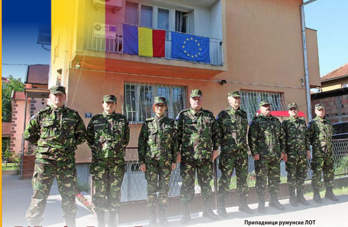
Припадници румунске ЛОТ куће у Бања Луци