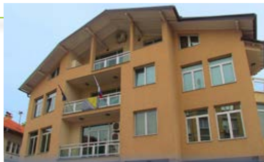
ЛОТ кућа Ново Сарајево

Припрема obroka је свакодневна обавеза за припаднике ЛОТ кућа. Оно што чини њихову кућу